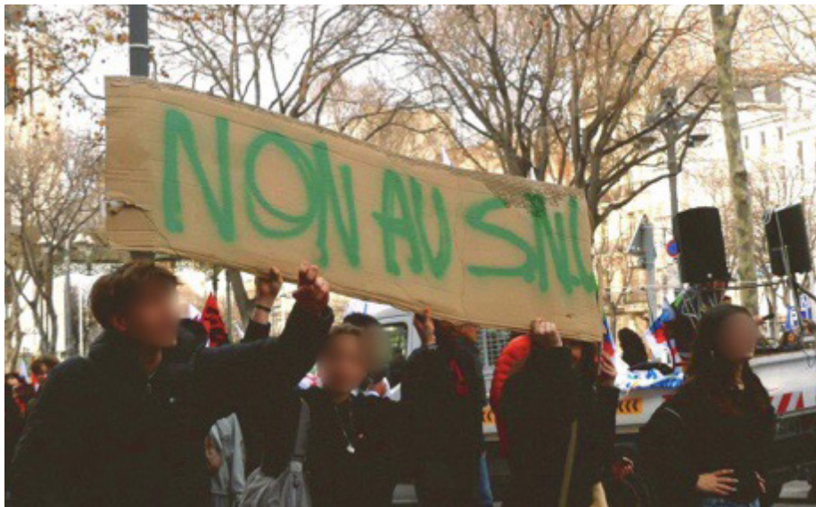
Manifestation de militants du MNL contre le Service National Universel