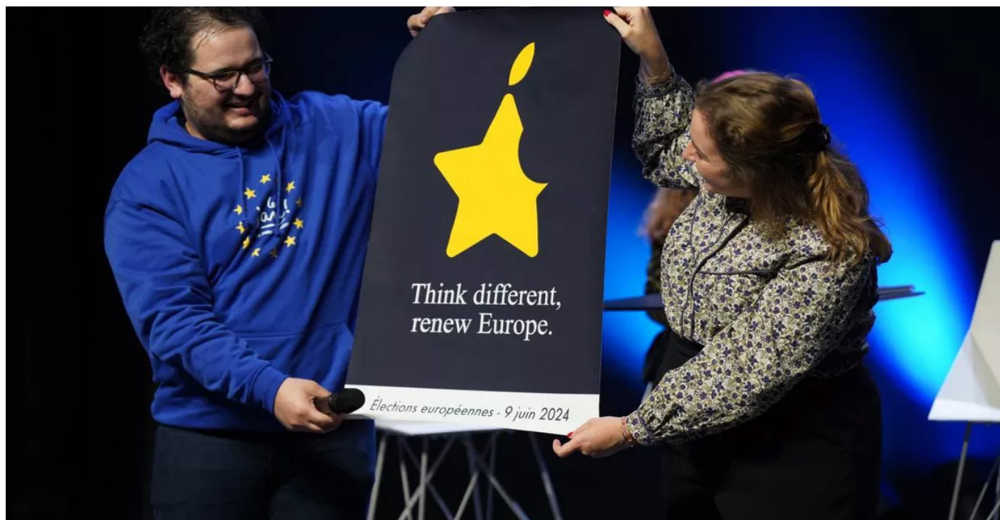
Affiche très originale du groupe Renew dévoilée dimanche 4 février

La fausse opposition, des vrais fascistes du RN aux faux communistes du P « C » F, en passant par toutes les nuances socialo-écology-LR, tente de maquiller ce scrutin en référendum « pour ou contre Macron » dans le but de pousser les travailleurs à soutenir leurs listes peuplées d'anonymes bureaucrates. En un sens ils ont raison, c'est un référendum. Mais, à l'heure de la menace de saut fédéral, voire impérial, européen, le seul bulletin contre Macron et cette UE de malheur qui casse notre pays et nos conquêtes sociales, c'est celui qu'on ne dépose PAS dans l'urne !